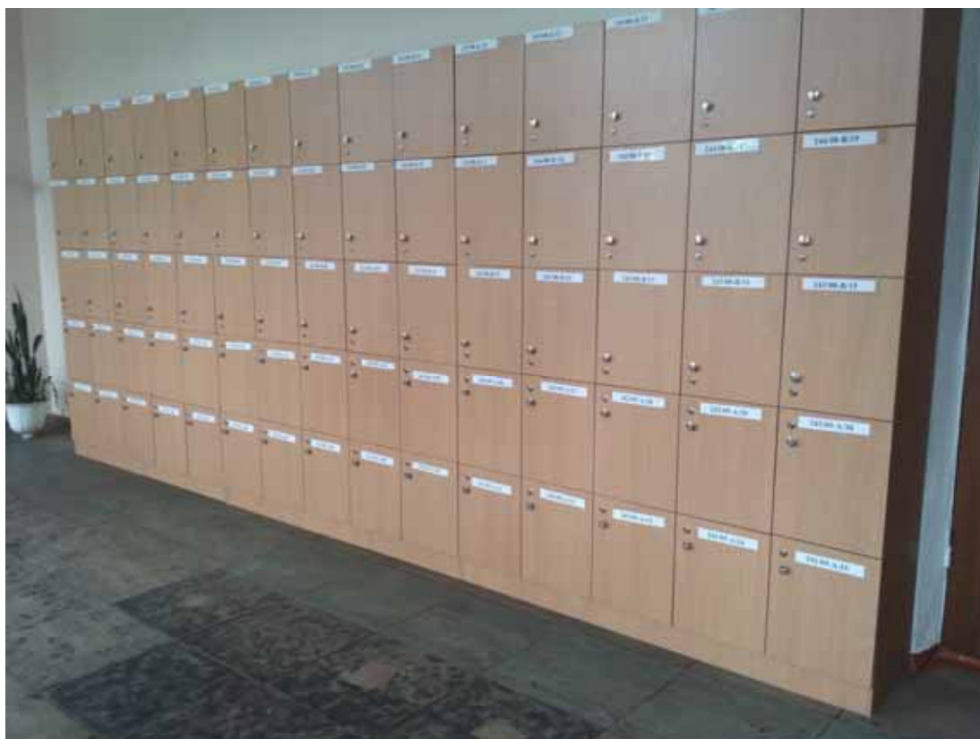
Фото реалізації проекту