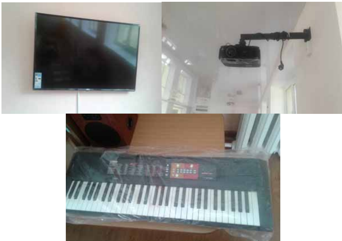
Фото реалізації проекту