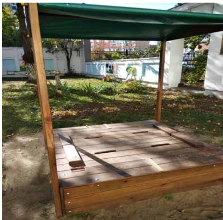
Фото реалізації проекту