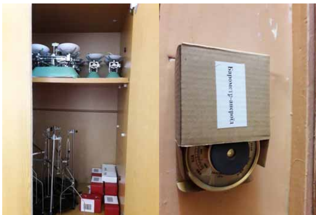
Фото реалізації проекту