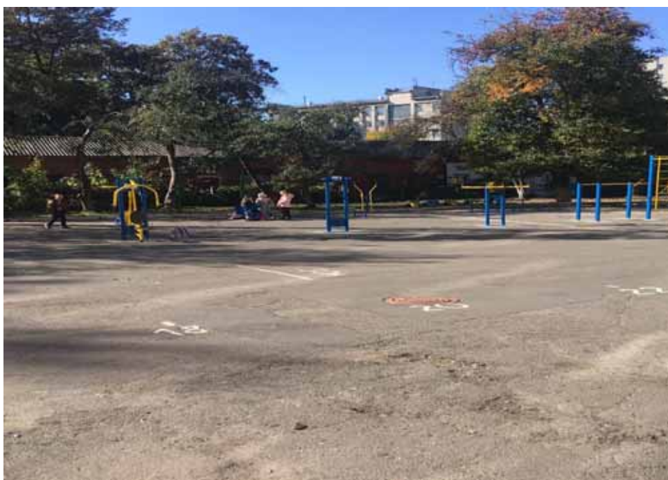
Фото реалізації проекту